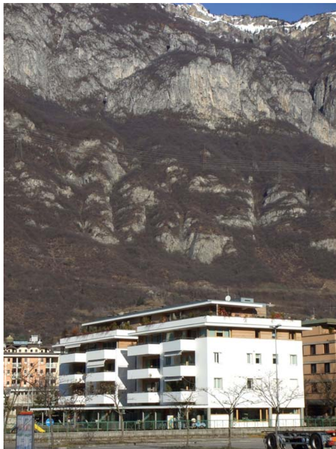
Edificio residenziale e commerciale a Darfo Boario Terme 2003/2006 (con arch. Sergio Ghirardelli)