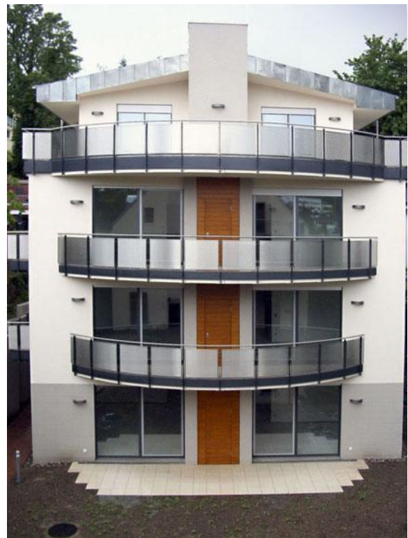
Figura 1 Appartamenti esclusivi

Alterna lavori pubblici come singolo professionista incaricato: Comune di Treviglio (Bg), - Casa di riposo di Pontoglio, - Comune di Pontoglio e Civate al Piano (Bg); ed in collaborazione: Comune di Brembate Sopra (Bg), - Azienda Ospedaliera Ospedale Treviglio e Caravaggio; oltre ad altri incarichi per pianificazione urbanistica, territoriale ed attuativa.