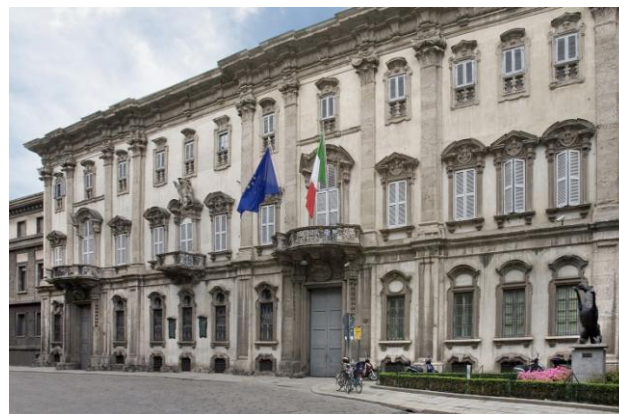
Figura 1 Palazzo Cusani – Milano

Da libero professionista si occupa di molti edifici religiosi, compreso un progetto per il restauro delle coperture della Chiesa di santa Maria delle Grazie (Cenacolo Vinciano) a Milano, di antichi Palazzi, fra i quali il Museo Civico di Crema e il Palazzo Cusani a Milano, sede N.A.T.O, di fortificazioni antiche dismesse, fra le quali la Rocca d'Anfo (Bs), ecc. Molti anche i lavori di Architettura, fra i quali scuole, piazze e centri sportivi.